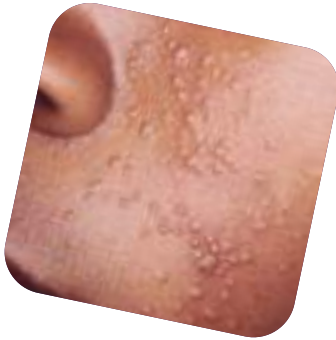
طفح اللبن الجلدي