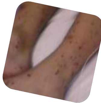
طفح المكورات السحانية