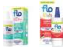
المحاليل الملحية الخالية من المواد الحافظة