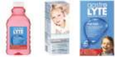
منتجات استعاضة الإلكتروللايت