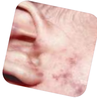
طفح المكورات السحانية