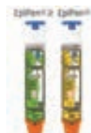
肾上腺素自动注射器